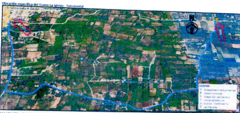
IMAGEN N°01. TRAZO DEL TRAMO DEL CASERIO LA IGLESIA - TORROMOTAL

Ubicación específica del Tramo Iglesia - Torromotal