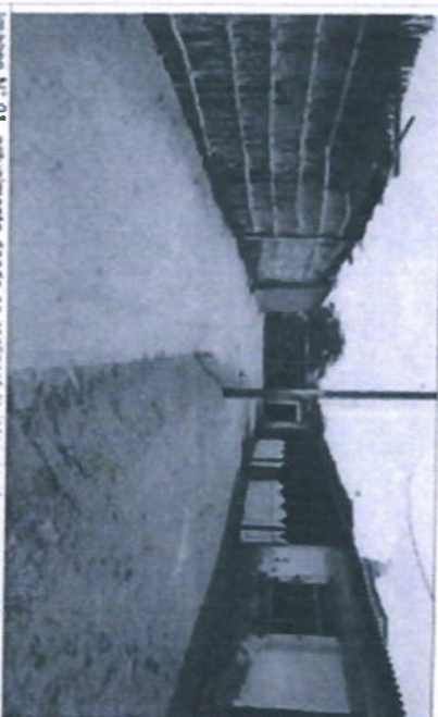
Imagen N.º 9: acuartelamiento donde se realizó la intervención de encuentro a nivel de terreno natural (Pasaje S/N 01) son calles anchas de aproximadamente 4 a 6,00 metros no cuentan con veredas peatonales.