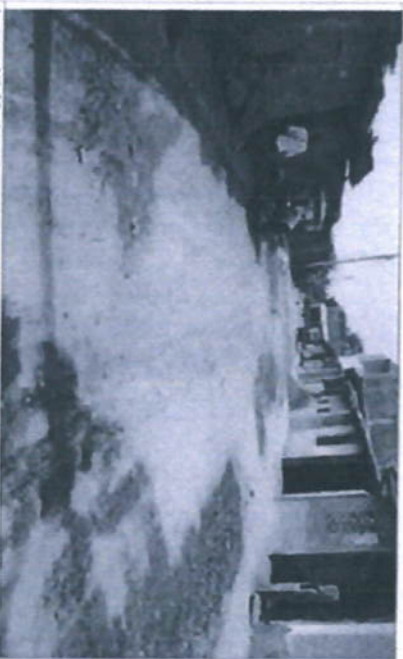
Imagen N.º 10. Actualmente donde se realizaba la intervención se encuentran a nivel de terreno natural (CALLE EL CONDOR) son calles anchas de aproximadamente 0.700 metros, cuentan con veredas peatonales en mal estado se propoñe reubicar postes nuevos de medidores eléctricos.

Imagen N.º 9: acuartelamiento donde se realizó la intervención de encuentro a nivel de terreno natural (Pasaje S/N 01) son calles anchas de aproximadamente 4 a 6,00 metros no cuentan con veredas peatonales.