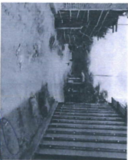
Imagen N.º 25. Actualmente donde se realizaba la recolección se cuentan a nivel de terreno natural (Paisaje S/N 02) son pocos árboles de aproximadamente 3,60 metros no cuentan con veleras palmatorias se propiamente raudales potales, muchos de medidores eléctricos

Imagen N.º 4. Actualmente donde se realiza la intervención se encuentran a nivel del terreno nuevo (CALLE CONCEPCION) son cables anchos de aproximadamente 7 metros, no cuentan con veredas peatonales, se propoñia reducir postes, metros de medidores eléctricos.