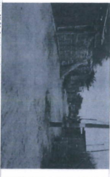
Imagen N.º 4. Actualmente donde se realiza la intervención se encuentran a nivel del terreno nuevo (CALLE CONCEPCION) son cables anchos de aproximadamente 7 metros, no cuentan con veredas peatonales, se propoñia reducir postes, metros de medidores eléctricos.