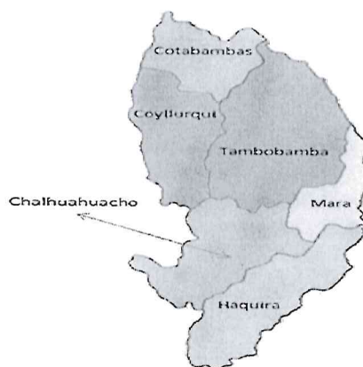
Distritos de la provincia de Cotabamba