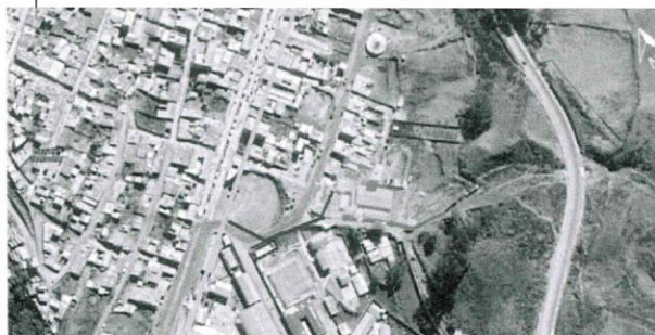
Ilustración 5: Plano de accesibilidad al terreno

El acceso al terreno se ubica a 227 metros de la carretera Lima-Tinyahuarco, la cual cruza parte del distrito, y a 120m de la Calle el Ecuador y Av. Nueva. Encontrándose ubicada a unos 347 metros desde la entrada del distrito.