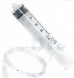
Figura 1 (No incluye diseño)