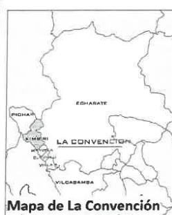
Mapa de La Convención