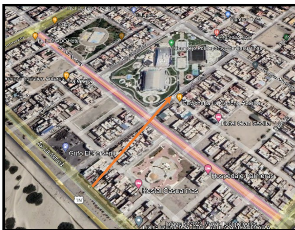
MICRO UBICACIÓN DEL BOULEVARD LAS PALMERAS