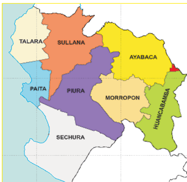
GRAFICA 02: UBICACIÓN A NIVEL DEPARTAMENTAL