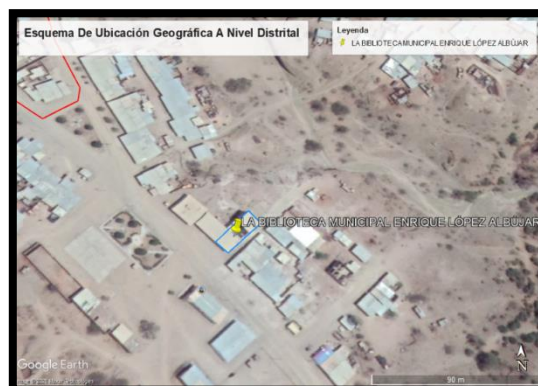
GRAFICA 04: UBICACIÓN DEL PROYECTO