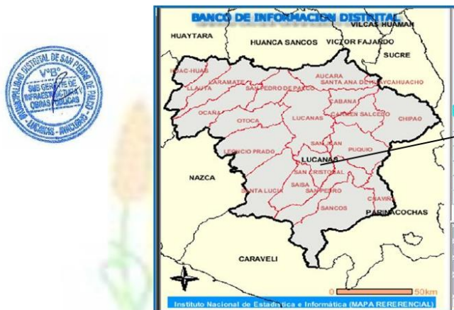
MAPA N° 02 UBICACIÓN PROVINCIAL

Ubicación provincial de LUCANAS del proyecto