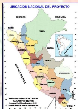
UBICACIÓN NACIONAL DEL PROYECTO