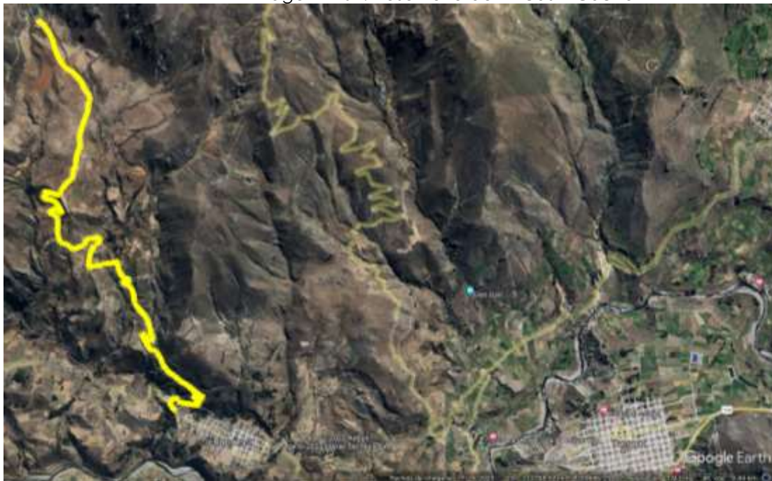
Imagen N°02: Trayecto de Ichupampa al reservorio de Ancashi Cucho