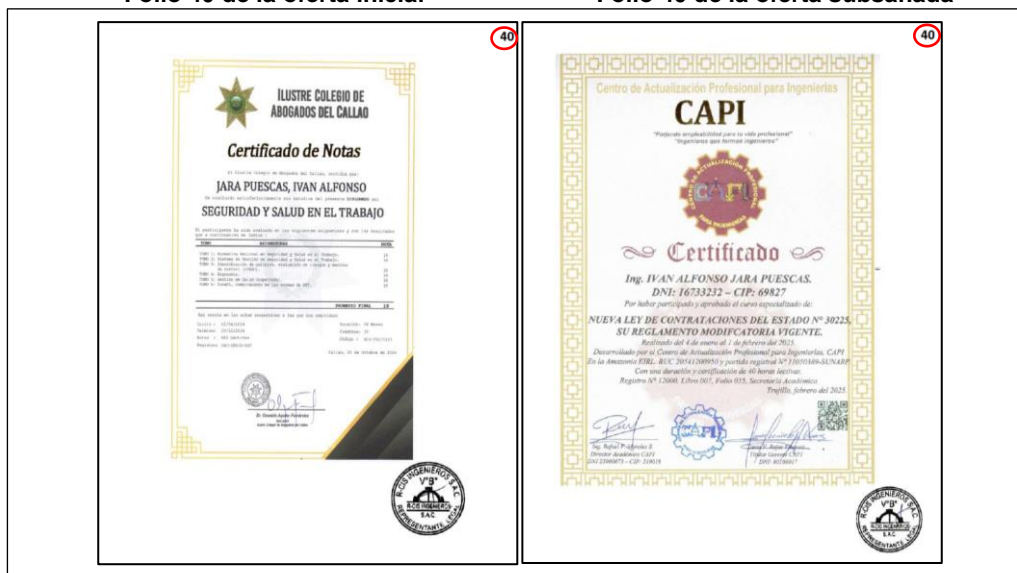
Folio 40 de la oferta subsanada