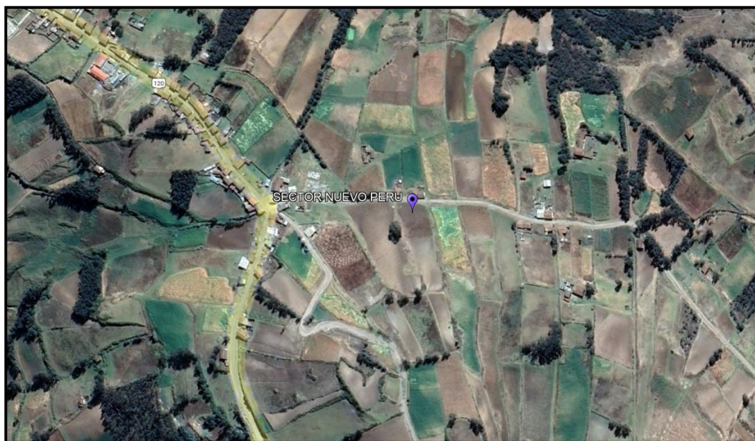
MAPA N°2: Ubicación Geográfica del caserío de Lluin