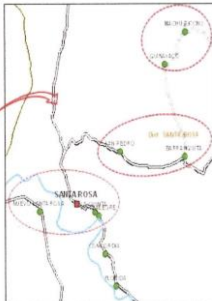
Localidad de Macchu Picchu, Quinayaco, Barranquilla, San Pedro, Santa Rosa y Nuevo Santa Rosa