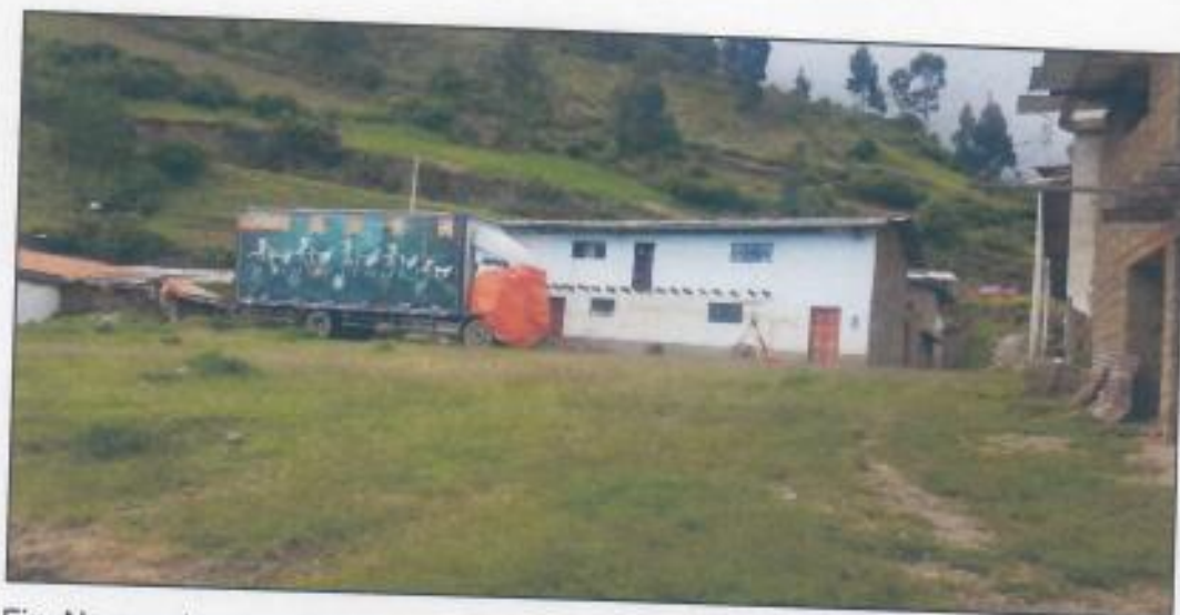
Fig. No cuenta con calles pavimentadas, ni anchos de vías definidos.