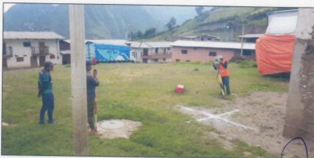
Fig. Muestra la inexistencia de espacio de esparcimiento.

ING. NINA ENCARNACIÓN GIRALDO INGENIERO CIVIL REG. CIP N° 82588