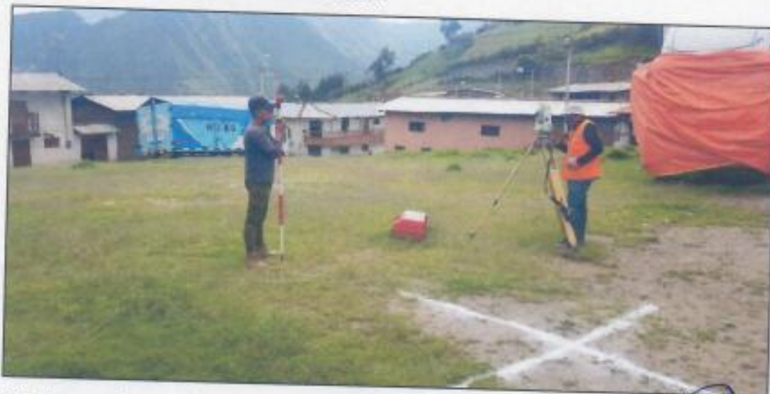
Fig. No cuenta con ninguna infraestructura existente.

En las fotos que vienen a continuación se pueden apreciar las áreas de las vías, típicas de este parque, que necesita intervención.