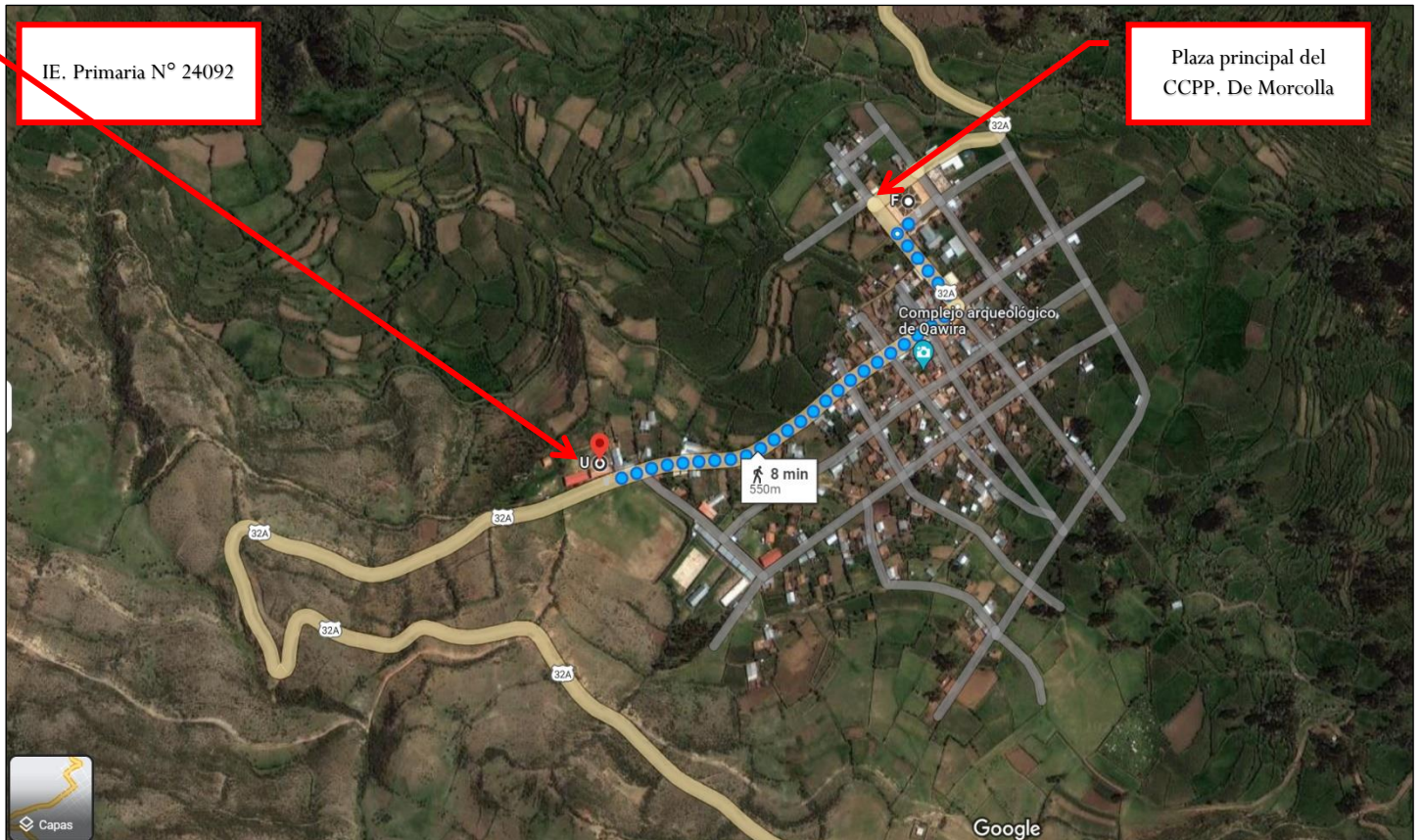
Figura a.4: Micro Localización del Proyecto.