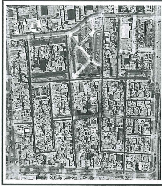
MICRO LOCALIZACION (DISTRITO DE NUEVO CHIMBOTE – URB. BUENOS AIRES 1ERA ETAPA)