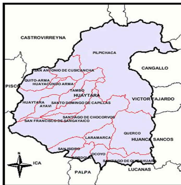
Figura N° 2: Ámbito del proyecto