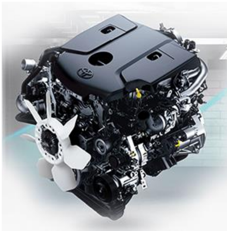
Ejemplo de un motor toyota con sistema moderno

Se exigirá que la marca del motor, sea de una marca de prestigio a nivel mundial, esto por una mejor garantía y facilidad de mantenimiento de la unidad. Existen marcas de vehículos de prestigio, que mandan a preparar sus motores a fabricantes internacionales de prestigio.