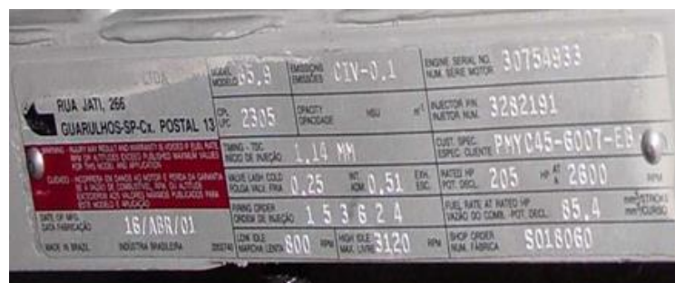
Identificación de Un Motor