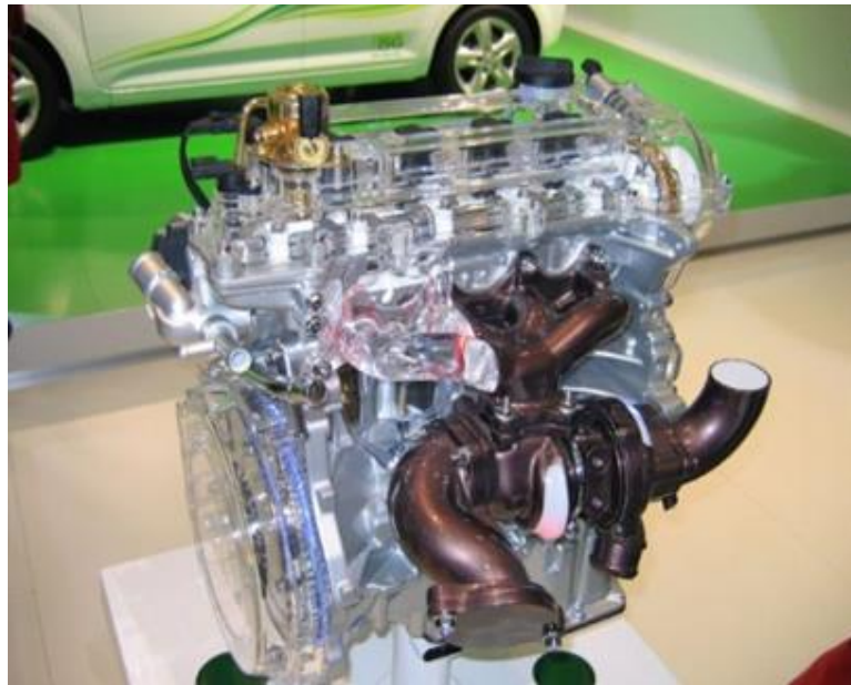
Turbocompresor en un motor

turboalimentado e intercooler o aftercooler, con la finalidad de permitir el mayor ingreso de aire a los cilindros, mejorando de esta manera la combustión para una misma inyección de combustible, con el consiguiente incremento de potencia y ahorro de combustible. Será de inyección directa controlado electrónicamente, siendo este diseño, propio del fabricante.