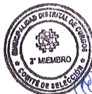
TITULAR MIEMBRO 2 DOLY NOELIA NAUCA ATILANO