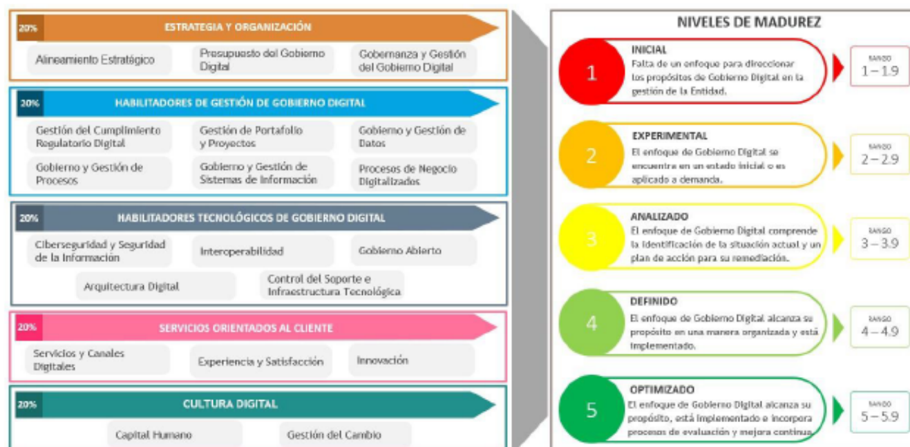
Descripción de Nivel de Madurez

Se empleó una escala de Nivel de Madurez de Gobierno Digital del uno (1) al cinco (5), como se muestra a continuación: