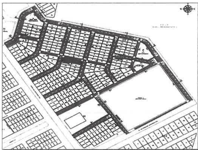
Figura N° 1: Límites del Asentamiento Humano Pedro Adolfo Labarthe.

El terreno donde se desarrollará el Expediente Técnico está ubicado en el asentamiento humano Pedro Adolfo Labarthe del Distrito de Ventanilla, Provincia Constitucional del Callao.