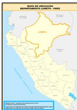
M. Ramón Castilla