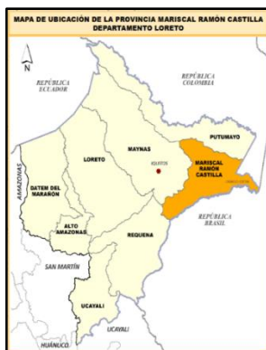
Depart: Loreto Distrito: San Pablo