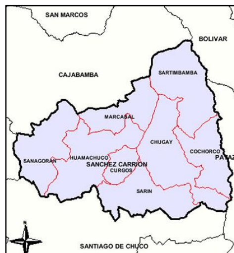
Imagen N° 04: Ubicación del Caserío La Conga en el Distrito de Huamachuco