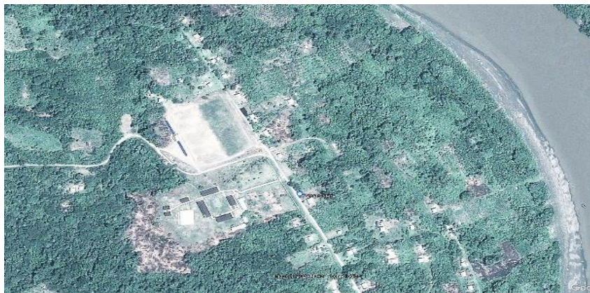
Coordenadas Datum UTM WGS84 CC.NN. Nuevo Mundo