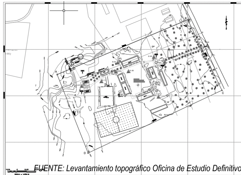
IMAGEN 03: ESTADO ACTUAL