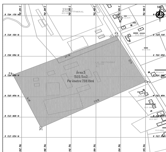
IMAGEN 02: AREA DE INTERVENCION