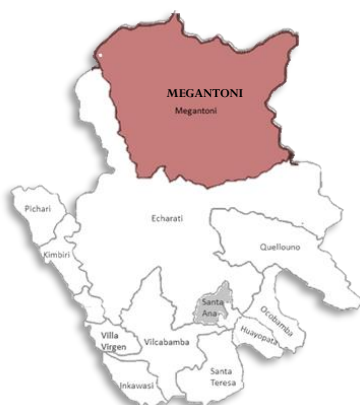
DISTRITO DE MEGANTONI