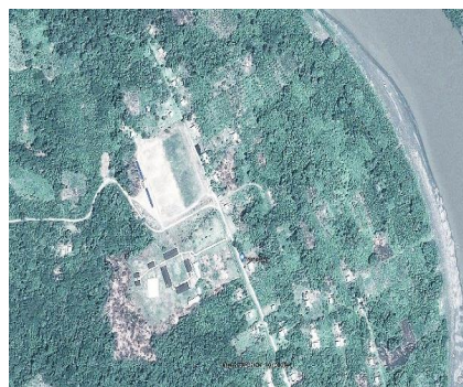
COMUNIDAD NATIVA NUEVO MUNDO