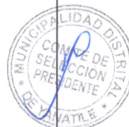
Imagen tomada del folio 138 de la oferta del postor