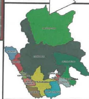
PROVINCIA DE LA CONVENCION