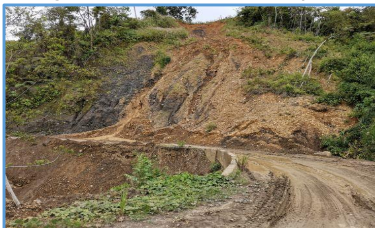
Fotografía N° 05: Cantera de afirmado Prog. 05+400