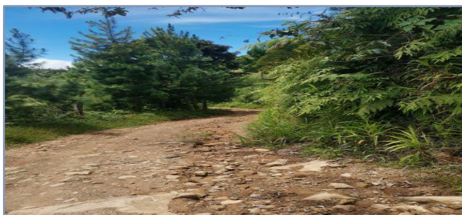
Afloramiento de piedras Ø 6"-8" en forma de cabezas duras

Las plazoletas de cruce son secciones ensanchadas de una carretera de un solo carril, destinada a facilitar el adelantamiento o el volteo del tránsito.