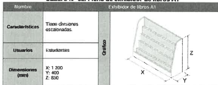
Cuadro N° 62. Ficha de exhibidor de libros A1