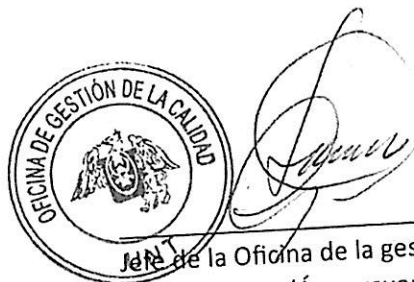
Jefe de la Oficina de la gestión de la calidad (Área usuaria)