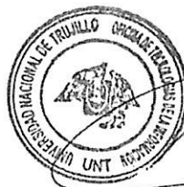
Jefe de la Oficina de Tecnologías de la Información (Área técnica)