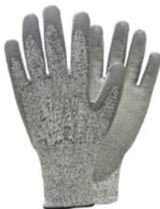
GUANTES DE TRABAJO