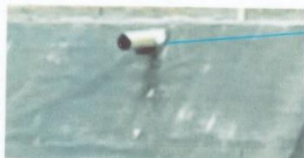
termofusión de la tubería hdpe de entrada y rebose con geomembrana