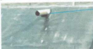
termofusión de la tubería hdpe de entrada y rebose con geomembrana