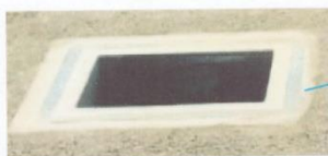
termofusión de material polylock con geomembrana en la caja de salida de tubería