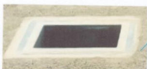
termofusión de material polylock con geomembrana en la caja de salida de tubería