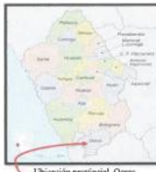
Ubicación provincial, Ocos