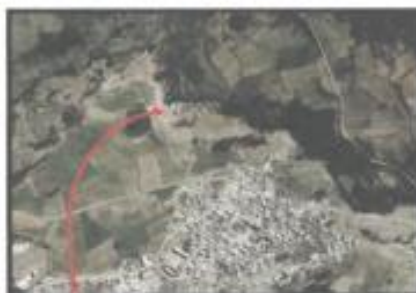
Ubicación del PTAR