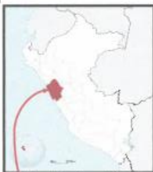
Ubicación departamental Ancash

Región : Ancash Departamento : Ancash Provincia : Ocos Distrito : Ocos Centro Poblado : Localidad de Ocos Altitud : 3230.00 m.s.n.m.