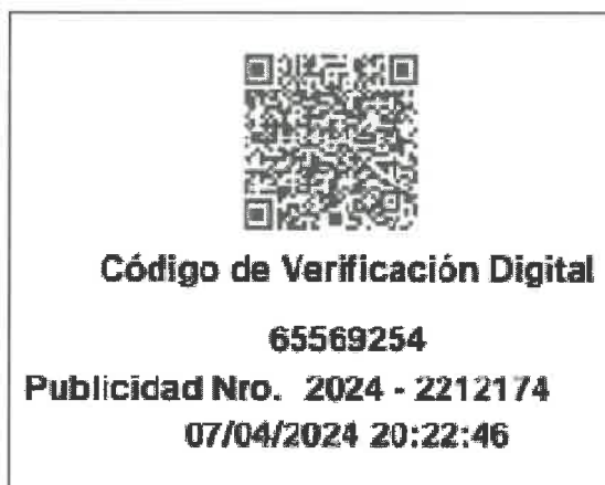
EL MISMO CODIGO QR VERIFICADO ARROJA FECHA 07/04/2024 Y DOCUMENTO DISTINTO AL DE LA OFERTA

-Se deja constancia que se debe tenerse en cuenta que la formulación y presentación de las ofertas es de entera responsabilidad de cada postor, de manera que las consecuencias de cualquier deficiencia o defecto en su elaboración o en los documentos que la integran deben ser asumidas por el mismo.