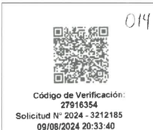
CODIGO QR DE LA VIGENCIA DE PODER PRESENTADA EN SU OFERTA FIGURA LA FECHA 09/08/2024

Se adjunta capturas de pantalla para una mejor apreciación: