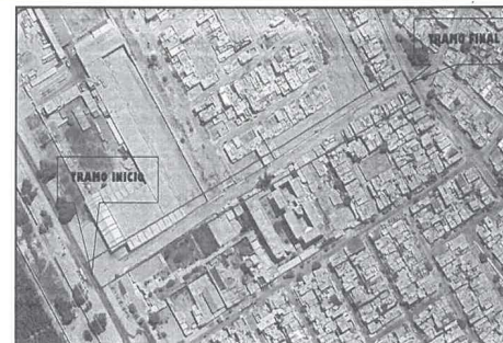
Imagen 01: En la imagen se muestra la ubicación satelital del proyecto.