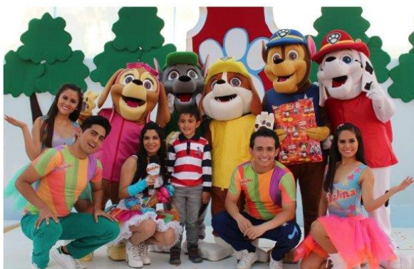
Imagen referencial de lo requerido por Promperú