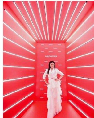
Imagen referencial de lo requerido por Promperú