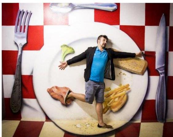
Imagen referencial de lo requerido por Promperú