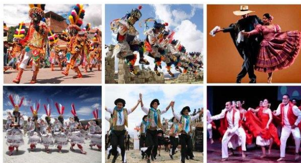
Imagen referencial de lo requerido por Promperú