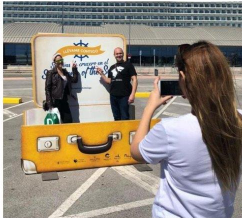
Imagen referencial de lo requerido por Promperú