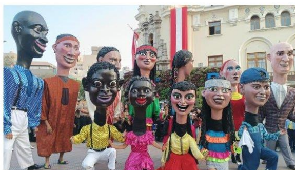
Imagen referencial de lo requerido por Promperú