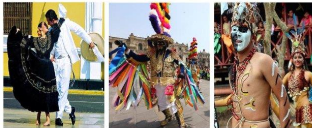
Imagen referencial de lo requerido por Promperu