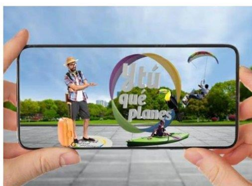
Imagen referencial de lo requerido por Promperú