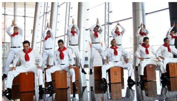
Imagen referencial de lo requerido por Promperú