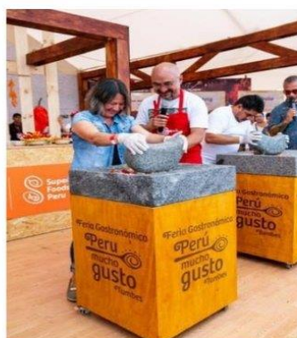
Imagen referencial de lo requerido por Promperu