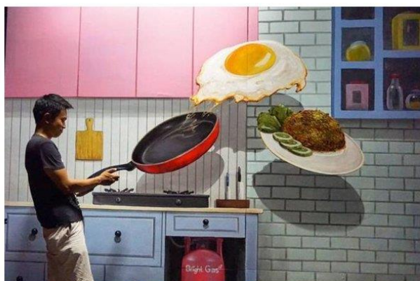
Imagen referencial de lo requerido por Promperú