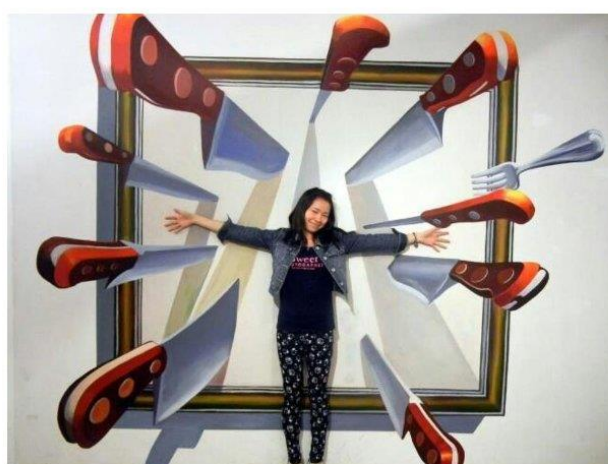
Imagen referencial de lo requerido por Promperú