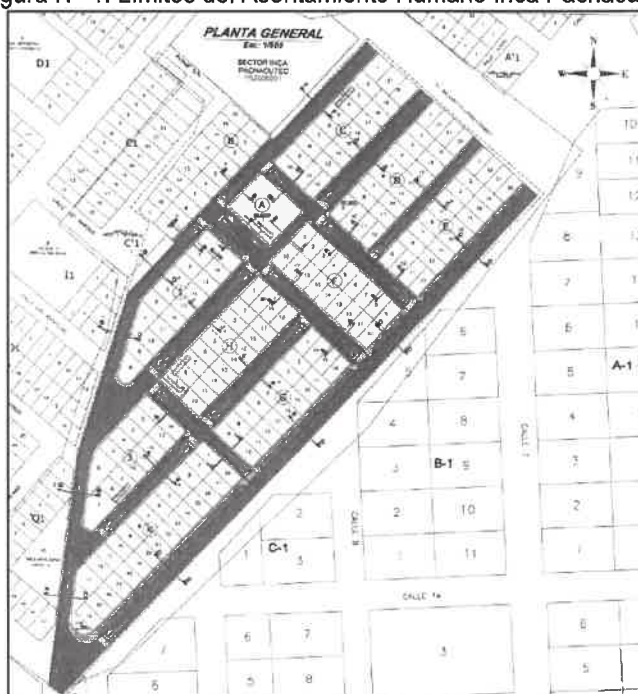
Figura N° 1: Límites del Asentamiento Humano Inca Pachacutec.

Fuente: Anexos de Ficha Técnica Estándar