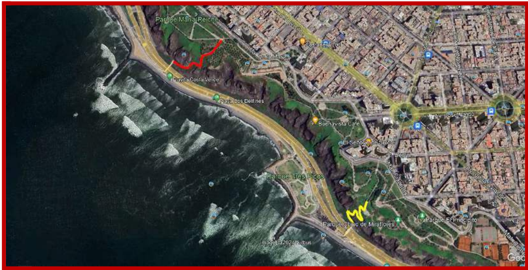
TABLA 2: Escaleras de acceso