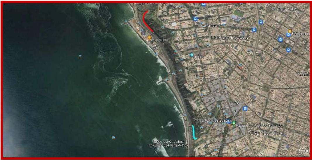
TABLA 4: Escaleras de acceso