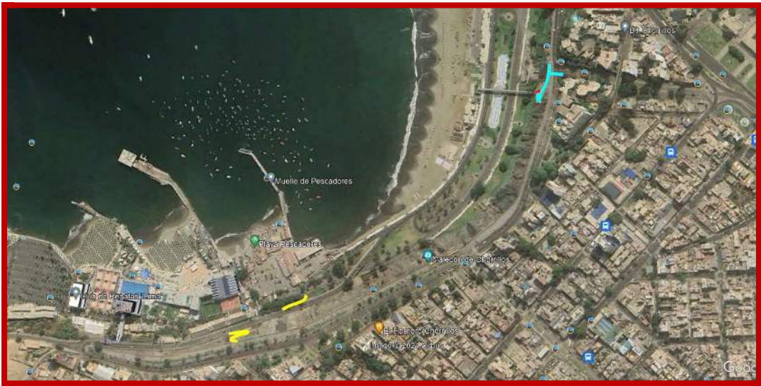
TABLA 5: Escaleras de acceso