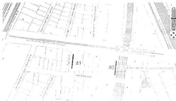
Imagen N° 1: Localización de los Pasajes Peatonales 40 y 41.