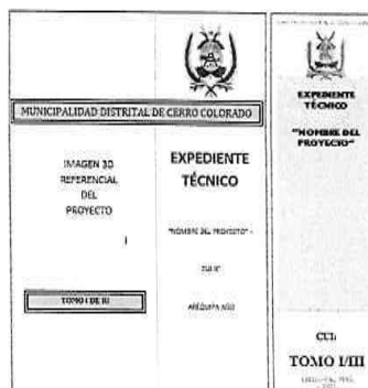
Figura 1. Forma de presentación del Expediente

Los expedientes deberán ser presentados en archivadores de palanca de lomo ancho. Cada archivador deberá considerar una carátula en la parte frontal y en lomo del mismo, para una rápida verificación. Se recomienda que dichas carátulas, deberán indicar como mínimo, lo indicado en la figura 1.