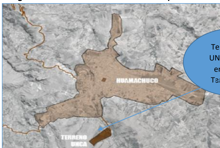
Imagen N° 001: Ubicación del estudio de pre inversión.