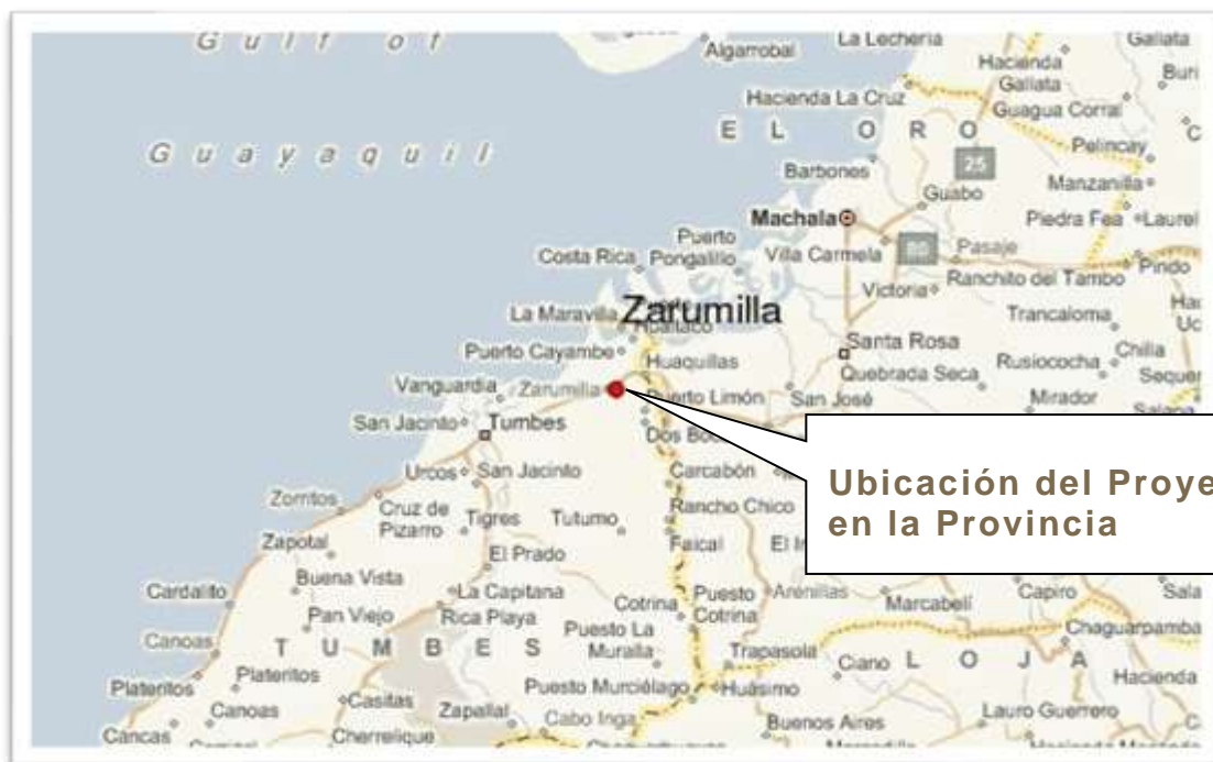
Ubicación del Proyecto en la Provincia