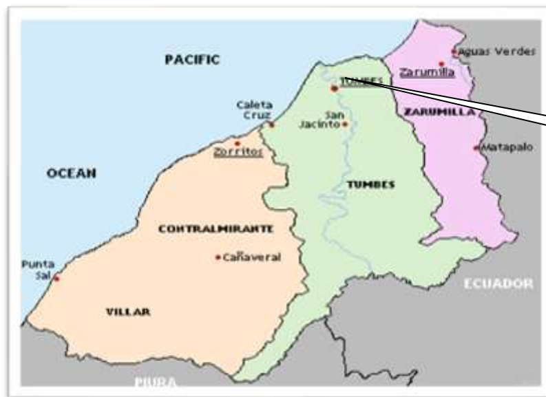
Ubicación en la Región