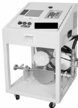
Figura N° 1. Imagen Referencial del Equipo de Flujo Másico Portátil