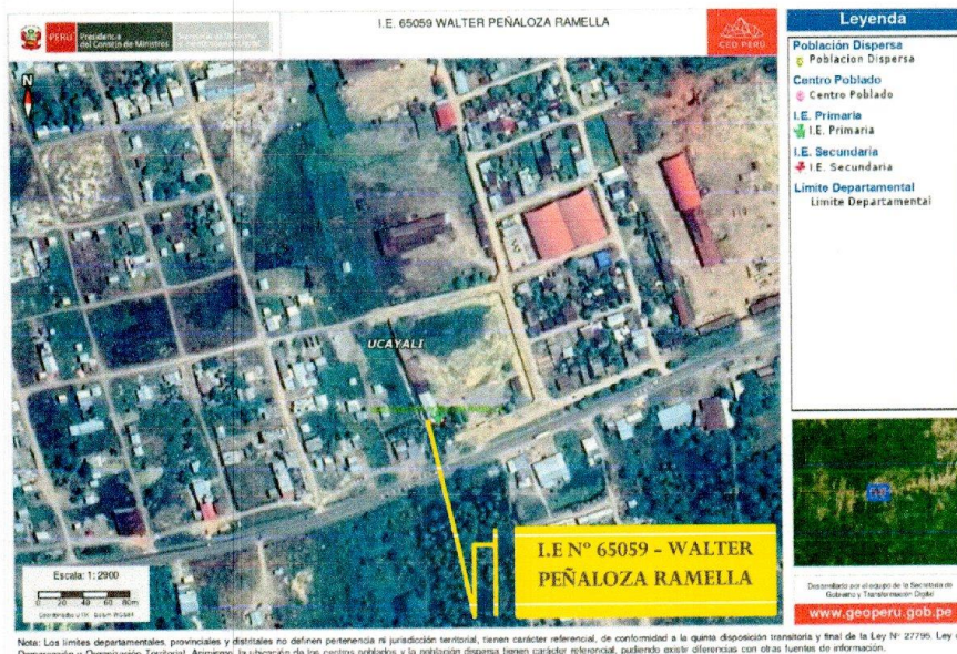
Ilustración 1. Vista Satelital de la Ubicación de la IE en el Centro poblado Mariela.