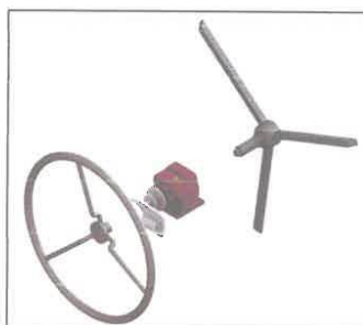
Imagen N° 02