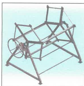
Imagen N° 03