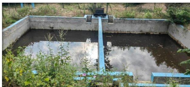
Imagen N° 05: Filtro lento