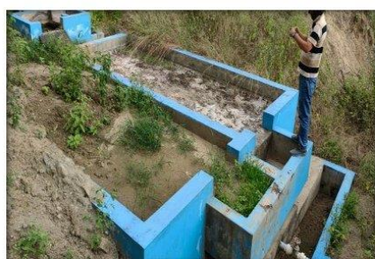
Imagen N° 03: Prefiltro N° 02