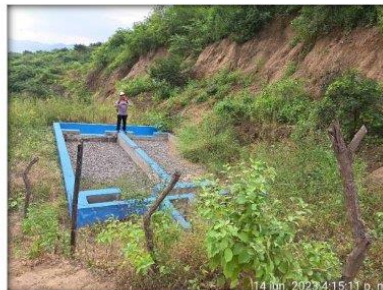
Imagen N° 02: Prefiltro N° 01