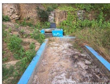
Imagen N° 04: Prefiltro N° 02