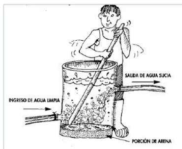
Esquema N°01: limpieza manual del medio filtrante