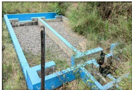
Imagen N° 01: Prefiltro N° 01