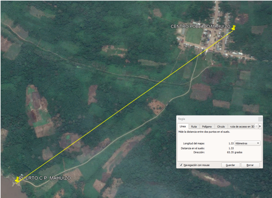
IMAGEN RUTA III