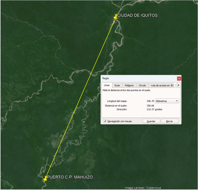
IMAGEN RUTA II