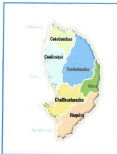
Límite de Micro localización I Distrito de Coyllurqui.

La vía, Ruta R-08, donde se ejecutará el puente vehicular y peatonal "Chahuay" está ubicada en la región Apurímac, provincia de Cotabambas, distritos Coyllurqui, en la localidad de Chahuay.