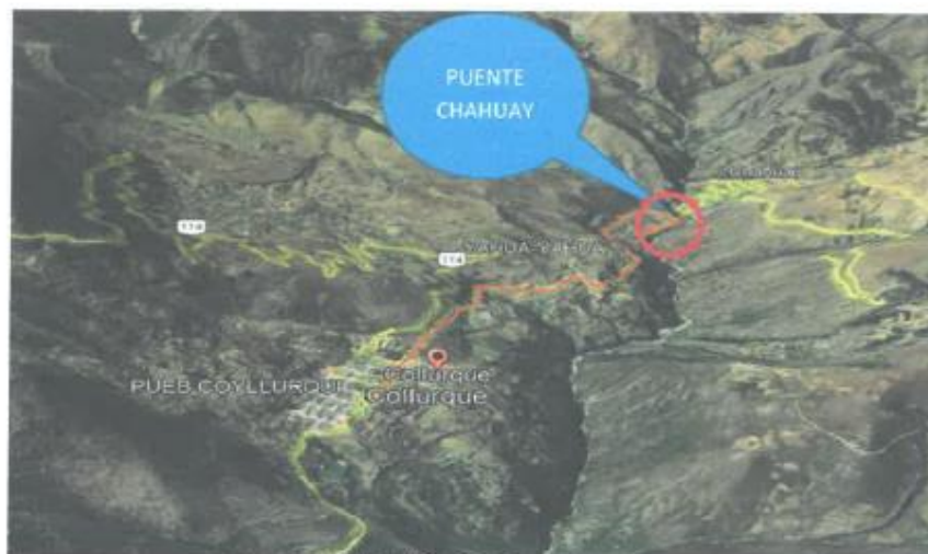
Micro localización del proyecto