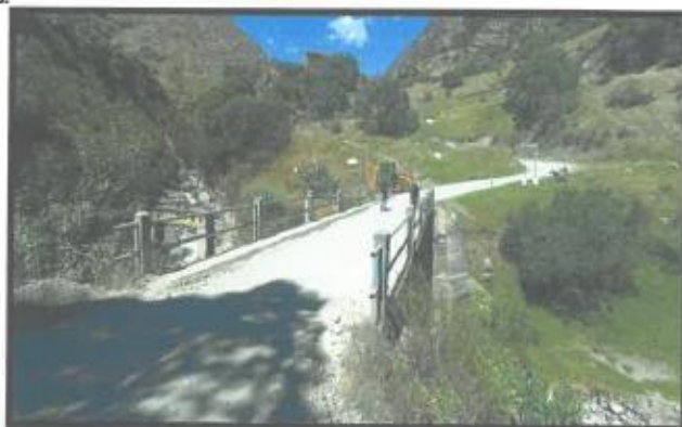
Vista panorámica del puente existente

La deflexión que presenta la estructura del puente de Chahuay, pone en peligro a todas las personas y movilidades que cruzan sobre él, por lo que es necesario el mantenimiento para brindar seguridad y comodidad a todos los usuarios den ámbito.