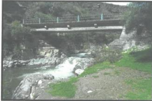
Elevación del puente existente.