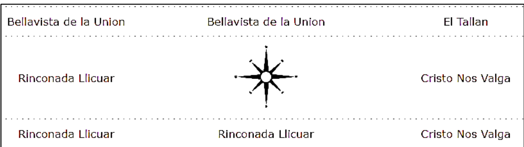
Distritos limitantes con Bernal