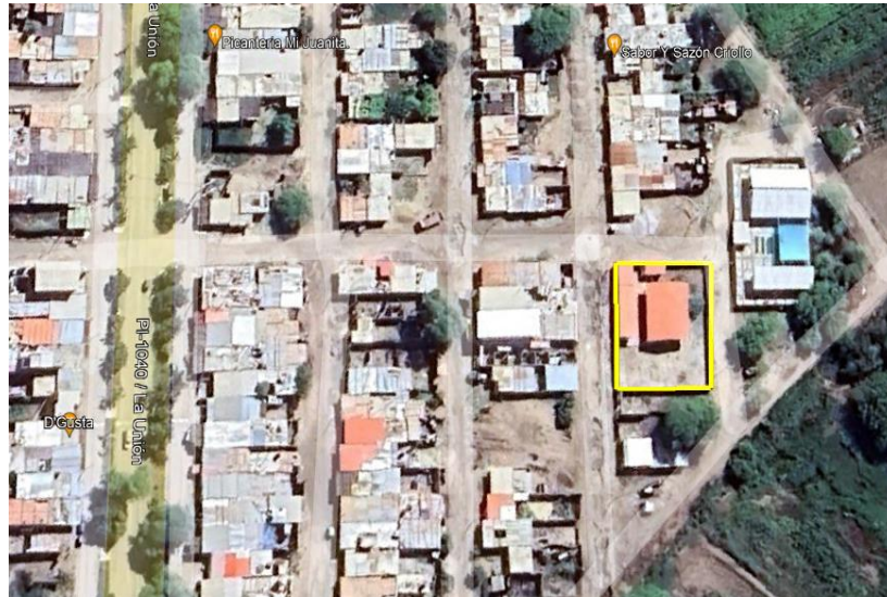
Imagen 1. MICROLOCALIZACIÓN DEL CENTRO DE REHABILITACIÓN