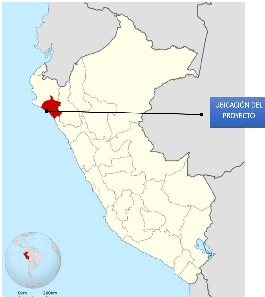
Gráfico N° 01 - Ubicación Geográfica – Departamento Lambayeque