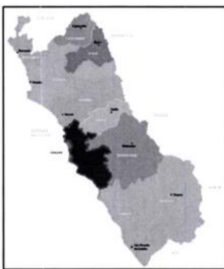
UBICACIÓN GEOGRÁFICA DE LA PROVINCIA DE LIMA