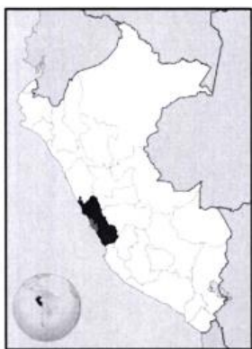
UBICACIÓN GEOGRÁFICA DEL DEPARTAMENTO DE LIMA